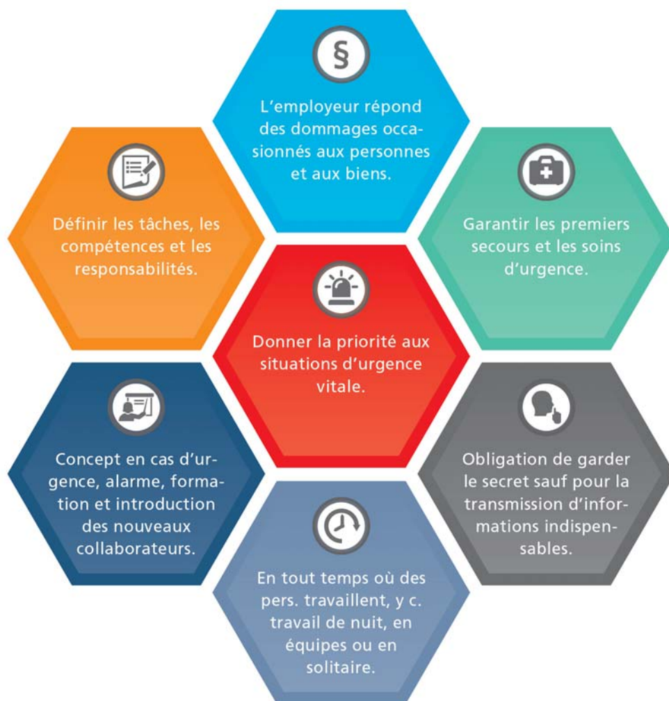
Illustration 336-2 : Les éléments du concept en cas d'urgence